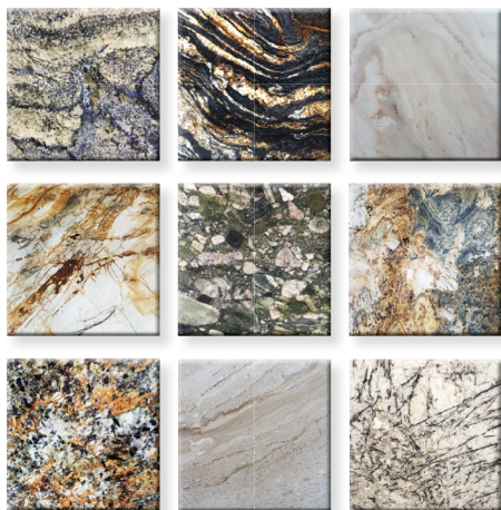
Unser Stein wurde von der Natur geschaffen. Farbliche Unterschiede und Zeichnung können wir daher nicht beeinflussen.

Ein Heizkörper ist meist ein Objekt, welches relativ viel Platz in Anspruch nimmt und wenn möglich optisch nicht im Weg sein soll. Wir bieten eine einfache und platzsparende Lösung bei der nicht nur das Design stimmt.